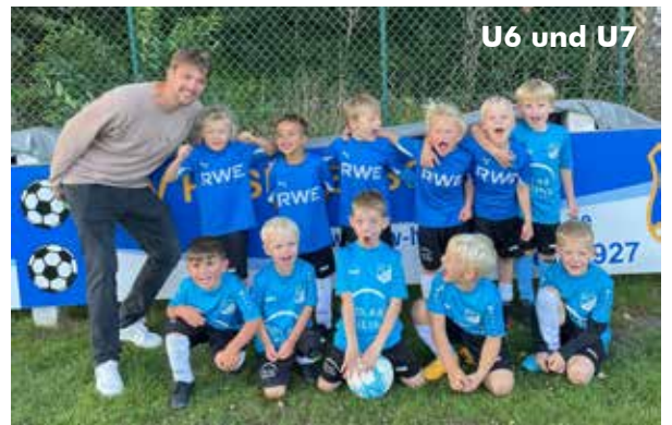
U6 und U7